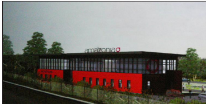
Amazonia, du groupe Nextalis, implantera son siège social sur ce site et ce dernier comportera également une salle de gym de 350 m 2 avec une façade donnant sur l'autoroute A6.

Nextalis, plus connu sous le nom de Gigagym ou Amazonia (un club existe déjà à Chalon avec 750 adhérents)